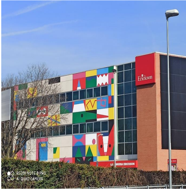
Sede Erikson Trento