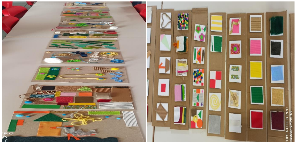
Scuola dell'Infanzia Via Allegri ... “Le schede tattili e i libri creativi legati alla filosofia di Bruno Munari”.